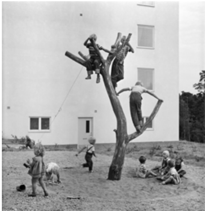
Fig. 02. Ilustración del interior del libro: Petersens 1955, Vällingby children.

una homotecia bien trazada entre el libro y la realidad del “problema de la vivienda” en Suecia, la secuencia de textos y de proyectos del libro desglosa el progreso social, técnico y económico, las demandas de la población y de sus minorías, y sus necesidades específicas, o las nuevas estructuras familiares, como alimento fundamental de los experimentos urbanos que permitirían dotar a todos los suecos de una casa para vivir una god bostad —una buena vida—.