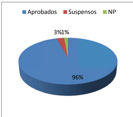
Gráfico 2: Resultados de la asignatura de Odontología Legal y Forense utilizando el sistema de portafolios

Estos resultados se refieren a la convocatoria ordinaria.