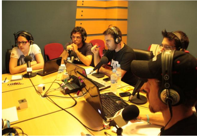
Figura 1: Alumnos durante la retransmisión