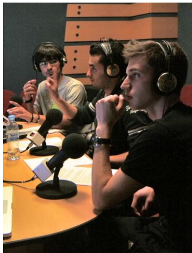
Figura 3: Alumnos durante la retransmisión

2.2.3. En relación al punto anterior, tuvieron que buscar el sonido directo del estadio (facilitado por Onda Madrid) y buscar un codificador de Canal + para el encuentro que tenía codificada su señal de televisión.