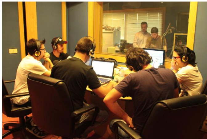
Figura 2: Alumnos durante la retransmisión.

Se siguió la dinámica normal y profesional de cualquier emisora de radio y cualquier departamento de deportes y de emisiones. Se realizaron un total de cuatro reuniones en la redacción de UEMCOM con el fin de: Cerrar la plantilla y distribuir los roles a desempeñar; diseñar el guión y escaleta de los espacios; producir una serie de entrevistas con profesionales de los medios y del mundo del fútbol que complementarían las emisiones y aportarían la pluralidad que eventos de tal magnitud necesitan; planificar las necesidades técnicas para poder dar una cobertura adecuada y estructurar su arquitectura sonora para dar forma acústica, expresiva y formal a los programas. Todas estas acciones fueron realizadas por los alumnos. A su formación académica se añadió el aprendizaje de las siguientes labores profesionales: