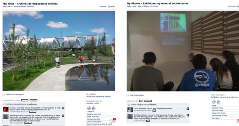
Figura 2. Izquierda: foto de viaje-excurción de arquitectura. Derecha: actividad de dibujo en una exposición de Arquitecturas Efímeras en Nuevos Ministerios en Madrid. En ambos casos hay comentarios de alumnos y profesor