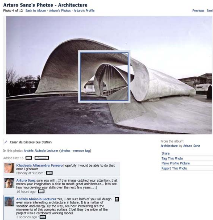
Figura 4. Debate sobre edificio alumno-alumna externa-profesor