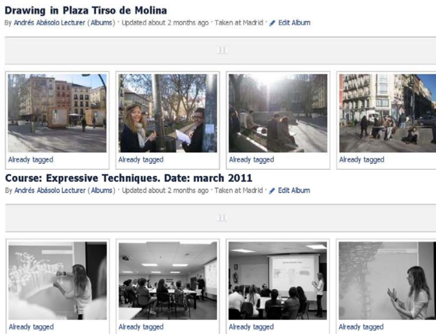
Figura 1. Álbumes de fotos. Arriba excursión para dibujar la plaza de Tirso de Molina en Madrid. Abajo fotos de sesión crítica en aula-taller