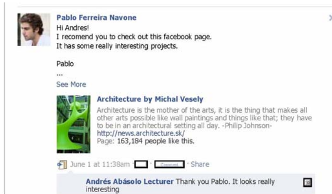
Figura 3. Recomendación de link de alumno a profesor

Incluso en el siguiente caso un alumno nos recomienda una imagen de Arquitectura, y pare ello me etiqueta. Y se produce una participación externa, ya que una alumna de una Escuela de Arquitectura de N.Y. amiga del alumno ve la imagen, la comenta, y se asoma a la página del curso. Por lo tanto, se produce una difusión del curso de nuevo. Dicho de otro modo, la red no puede ser cerrada, la comunidad de aprendizaje es permeable.