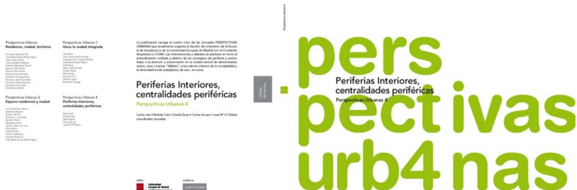
Figura 1. Portada de la publicación PP.UU.4

- Jornada, colección y nº 4 “Periferias Interiores, Centralidades Periféricas”.