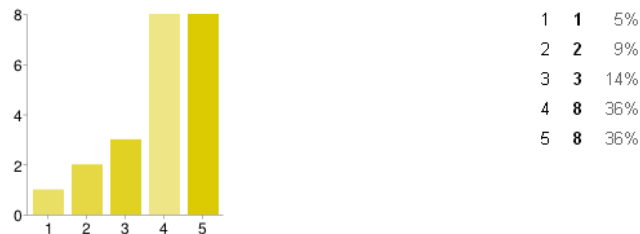
Figura 3. Pregunta: En caso de NO haber estudiado con las Crónicas de Enriq, ¿Crees que te hubiera hecho comprender mejor la asignatura? En la escala 1 equivale a nada y 5 a mucho más

En este caso nos centramos en aquellas personas que no han utilizado la metodología, lo cual equivaldría a todos aquellos alumnos que se encuentren cursando cuarto de criminología UEM en este momento. Un 36% cree que le hubiera motivado mucho más (5 en la escala) y otro 36% responde un 4 en la escala.