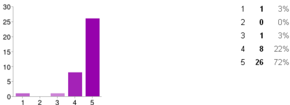
Figura 1. Pregunta: ¿Te parece una metodología docente innovadora? En la escala 1 es muy poco innovadora y 5 absolutamente innovadora

De este modo puede observarse como la mayoría de los alumnos se encuentran entre el 4 y el 5 de la escala. Es decir, un 72% de los respondientes creen que se trata de una metodología absolutamente innovadora.