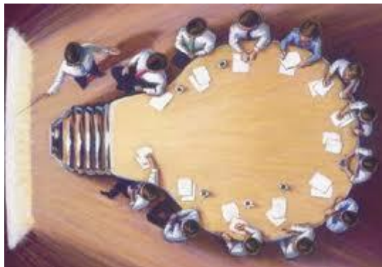
Figura 1. Lluvia de Ideas

A continuación se realizaran cada una de las preguntas en alto para que cada grupo exponga su experiencia. El profesor irá recogiendo y escribiendo en la pizarra las ideas y experiencias comentadas por cada uno de ellos.