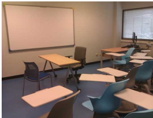
Figura 3. Espacio utilizado.

El espacio es esta técnica es un muy importante, para conseguir que los personajes puedan asumir su papel, habrá una mesa en medio con dos sillas, una a cada lado, donde se sentaran entrevistador y entrevistado.