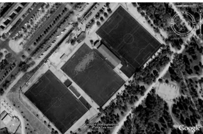
Figura 1. Visión satelital del Centro de Tecnificación y campo en el que se jugaron los partidos.

en un campo de 45 x 60 m. Los 6 jugadores de campo de ambos equipos fueron analizados en cada partido.