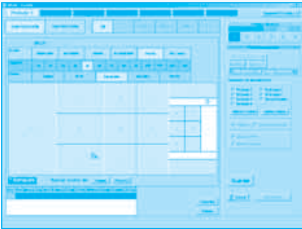
Figura 1A. Pantalla para registrar las acciones en las micro-situaciones de juego en igualdad numérica con o sin posesión.