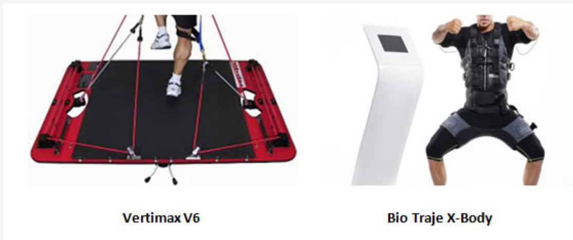
Figura 2. Material utilizado durante el entrenamiento

Cada una de las sesiones fue precedida por un calentamiento de unos 7' de duración realizado sin equipamiento, semejante al realizado en la sesión de recogida inicial.