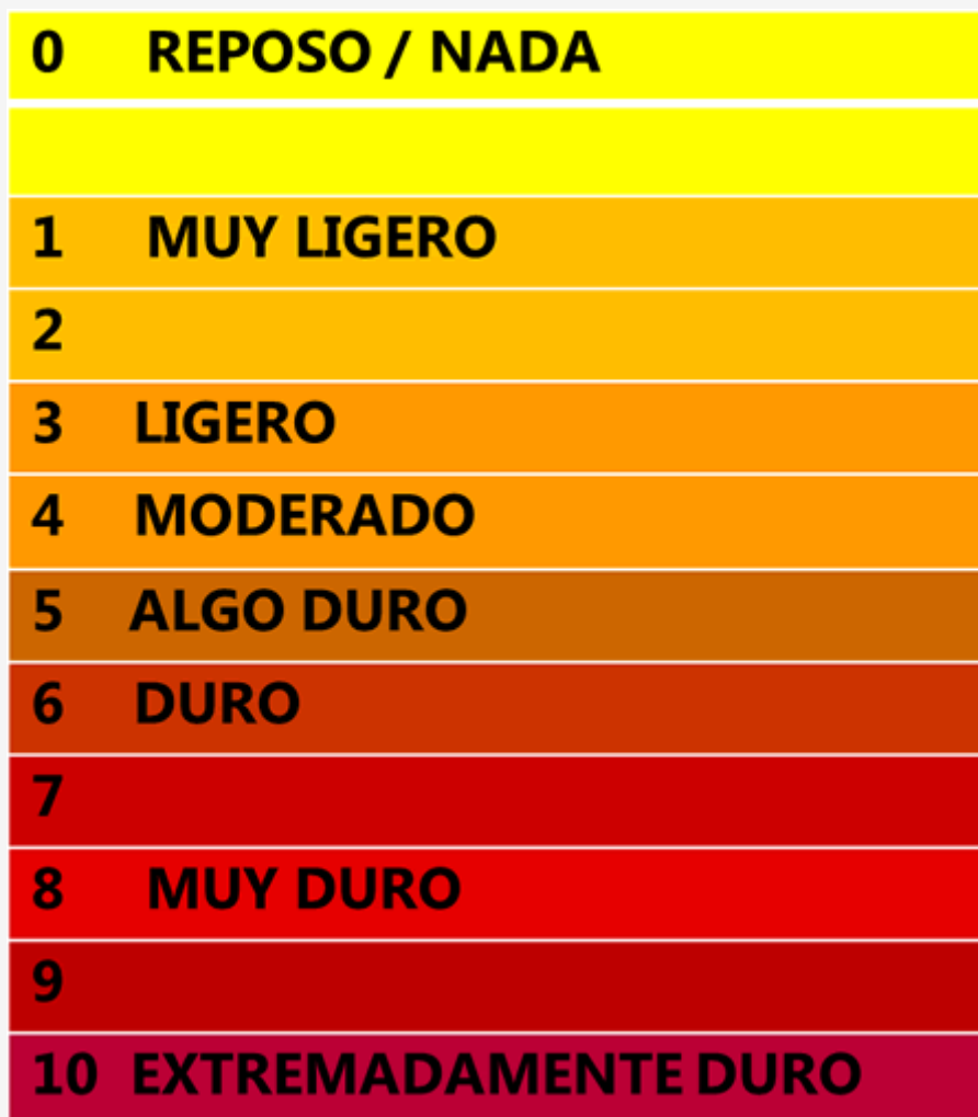
Figura 1. Escala de esfuerzo de Borg

Con la intención de controlar una intensidad deseada de >6 durante cada uno de los entrenamientos, fue registrada la Percepción Subjetiva del Esfuerzo (RPE) mediante la escala de Borg CR10 (Borg, 1998). (Figura 1). Dicho registro se realizó durante y después de cada entrenamiento. Aunque con posterioridad estos datos no fueron analizados.