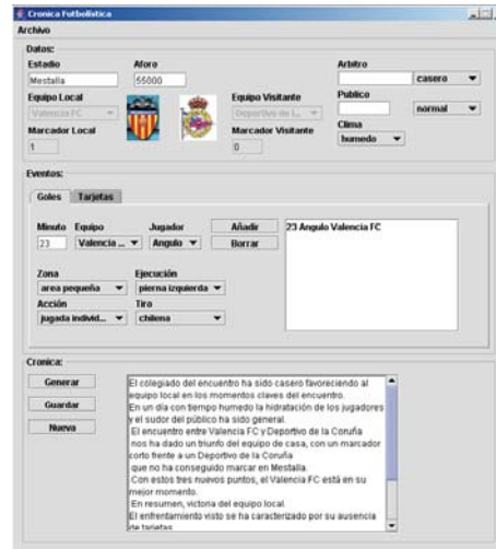
Figura 2: Interfaz basada en formularios