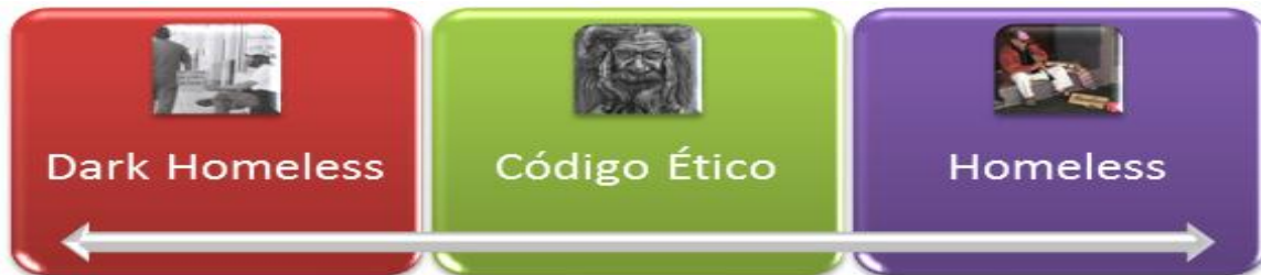
Figura 2. Código ético homeless (Silva, 2016a).

Por último, queremos dar una pincelada de algo que consideramos importante en esta “lección”, estamos hablando de la subcultura y los arquetipos (Jung, 2009). Algo que hemos podido observar a lo largo del estudio del fenómeno homeless es que poseen una subcultura propia compuesta de valores subterráneos (Matza & Sykes, 1971) y de otros que se subsumen desde las capas más elevadas de la sociedad. Así, junto a la economía moral (Thompson & Fontana, 1979), la búsqueda de trabajo o el rechazo al delito también se adhieren otros códigos conductuales como el racismo, la ley del más fuerte o la venta de sustancias tóxicas. Vemos, pues, un catálogo de valores contrapuestos (véase Tabla 1). En tributo al positivismo hemos querido trazarlo a modo de categoría polarizada (véase Figura 2) para, posteriormente, comunicaros que la mayoría de la muestra analizada se encontraba en un punto intermedio del continuum :