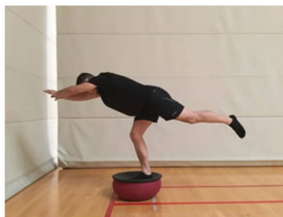
Posición Final. "Superman"