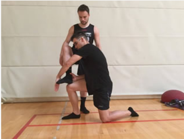
Posición Inicial. Fuerza excéntrica lateral