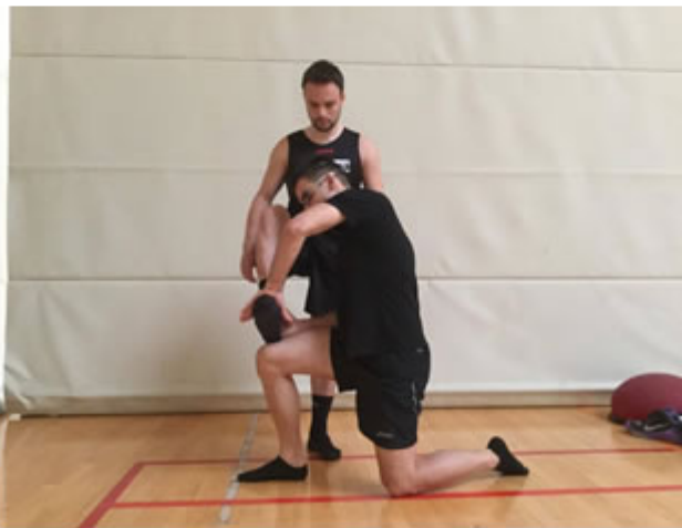
Posición Inicial. Fuerza excéntrica vertical