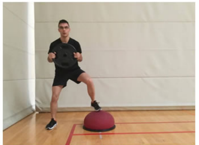
Posición Final. Salto con disco