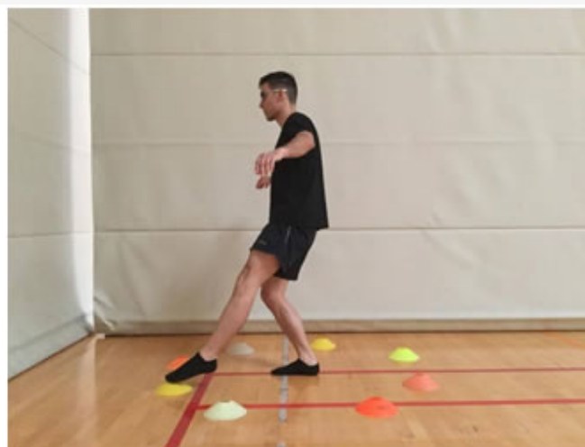
Posición Final. "Reloj"