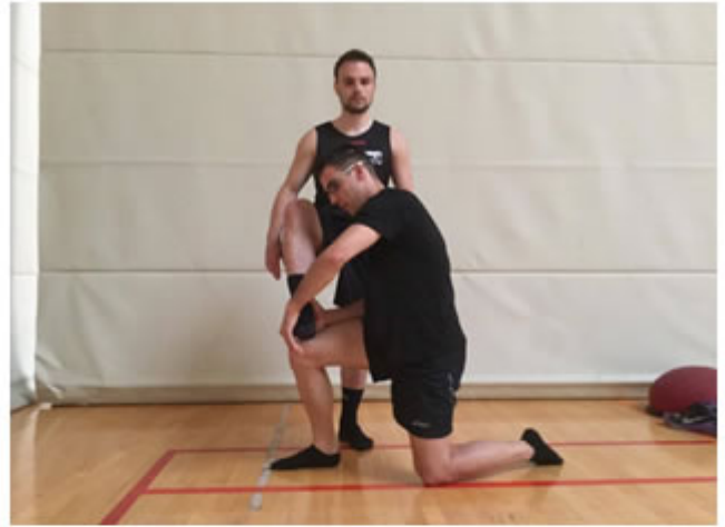
Posición Final. Fuerza excéntrica lateral