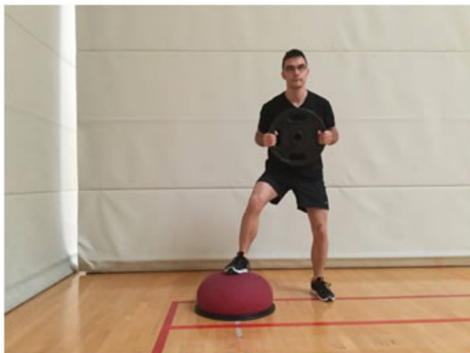
Posición Inicial. Salto con disco