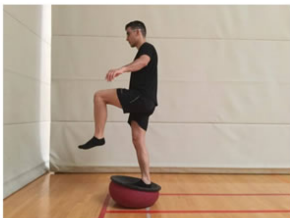
Posición Inicial. "Superman"