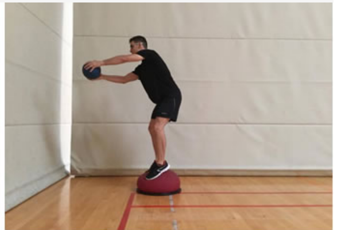
Posición Final. Lanzamiento de balón medicinal