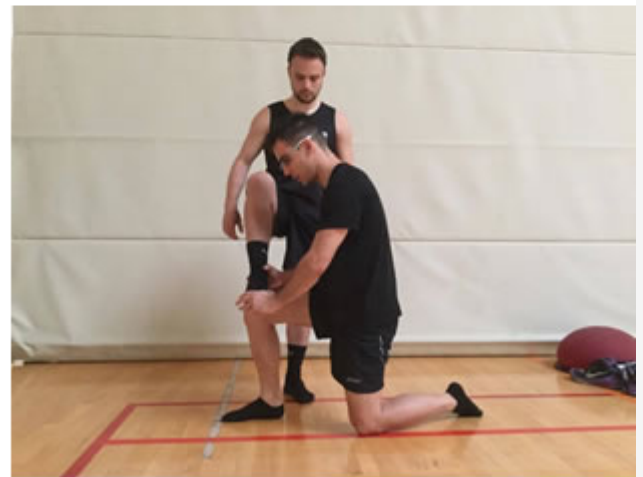
Posición Final. Fuerza excéntrica vertical