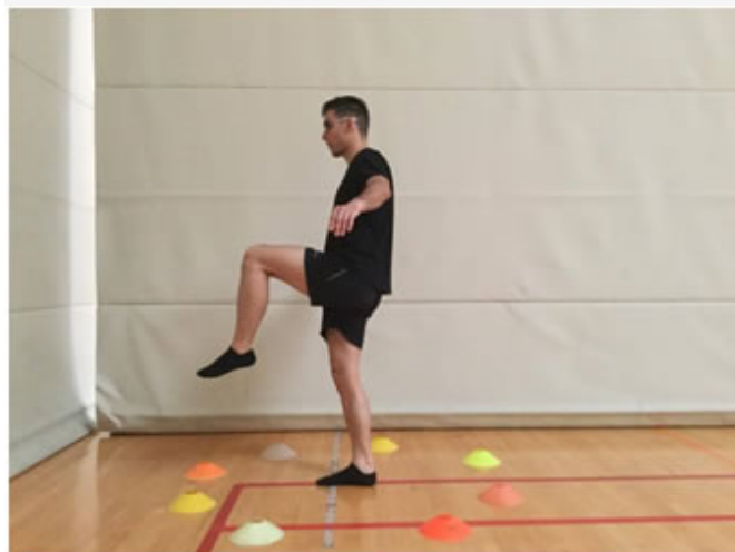
Posición Inicial. "Reloj"